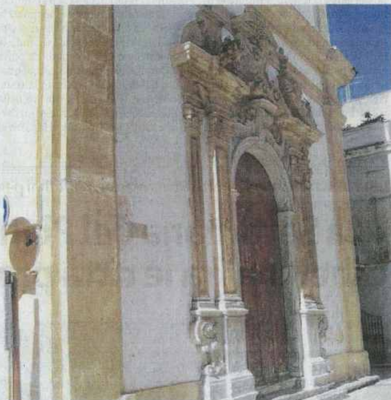
La facciata della chiesa di San Giuseppe