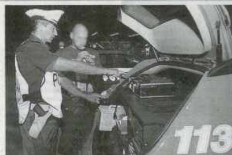
Test per la misurazione del tasso alcolico

Si apre oggi il lungo week-end dedicato al fungo porcino a Buseto Palizzolo: incontri, visite al bosco, mostra micologica, cooking show e degustazioni. Come prima attività, stamattina dalle 10, si terranno gli incontri coi ragazzi della scuola media di Buseto, col gruppo micologico "Tonino Pocerobba" di Valderice. Le iniziative continueranno domani e domenica. (*MAX*)