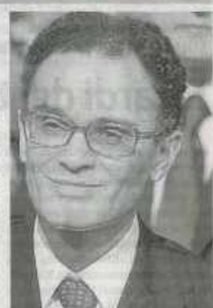
Magdi Cristiano Allam